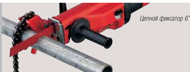
Цепной фиксатор 6"